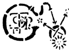
Selo posto no frontespício da maioria das cartas de Martines de Pasqually

Mas o estudo do homem não deve se limitar ao plano físico: a anatomia e a fisiologia apenas constituem o estudo da crosta humana , sua parte mais superficial, e não seriam suficientes. O verdadeiro homem é o homem-Espírito, e a psicologia aproxima-se, mais que todas as outras ciências, aos fins indicados ao discípulo pelos mestres Martinistas.