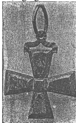
A jóia dos Rosa+Cruzes das Lojas de Martines